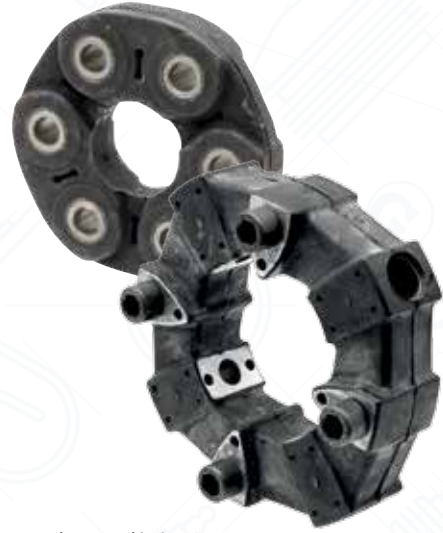
Embrague elástico GRANIT Referencia: 70806020