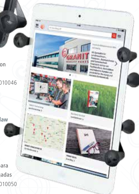
RAM MOUNTS Soporte X-Grip para tablets de 7 pulgadas Referencia: 5070010050