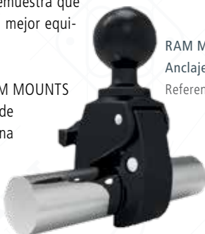
RAM MOUNTS Anclaje de barra Tough Claw Referencia: 5070010031